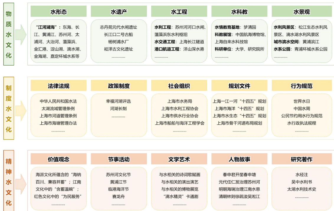
图 1 上海水文化结构图谱

三类水文化共育城市水文明。水文化是人与水的关系反映，是人类与水在密不可分的生产生活中所创造的物质财富和精神成果的总和，由物质水文化、制度水文化、精神水文化三个层面的文化要素构成（如图 1 所示）。上海水文化资源丰富，物质型、制度型、精神型三种水文化类型各具特色，赋予上海水文化鲜明的城市特质，广泛浸润现代城市与社会生活。丰富的物质水文化，成为城市文脉赓续与市民休闲的重要场域。物质水文化是指水本身的形态及人类与水交互过程中所形成的物质载体，由水形态、水遗产、水工程、水科教、水景观五个类型构成。江、河、湖、海见证上海地理格局的演变，为市民提供多元化的生态体验空间；崧泽、广富林等与水文化相关的考古遗址，成为古文化溯源的重要载体；元代水闸遗址等古代水利工程，成为市民了解上海治水用水历史的窗口；各类水情教育基地、科教展馆，有力