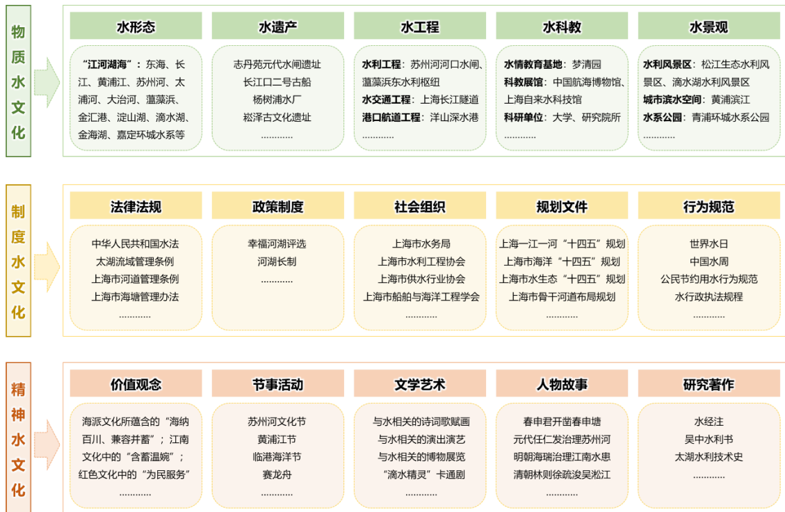
图 1 上海水文化结构图谱

丰富的物质水文化，成为城市文脉赓续与市民休闲的重要场域。物质水文化是指水本身的形态及人类与水交互过程中所形成的物质载体，由水形态、水遗产、水工程、水科教、水景观五个类型构成。江、河、湖、海见证上海地理格局的演变，为市民提供多元化的生态体验空间；崧泽、广富林等与水文化相关的考古遗址，成为古文化溯源的重要载体；元代水闸遗址等古代水利工程，成为市民了解上海治水用水历史的窗口；各类水情教育基地、科教展馆，有力推进水文化教育普及；各类高品质水景观遍布全市，水利风景区建设有力推进，城市滨水公共空间错落有致，兼具江南韵味和现代滨海城市特征，体现人水和谐共生的城市生态价值取向，是市民休闲的好去处。