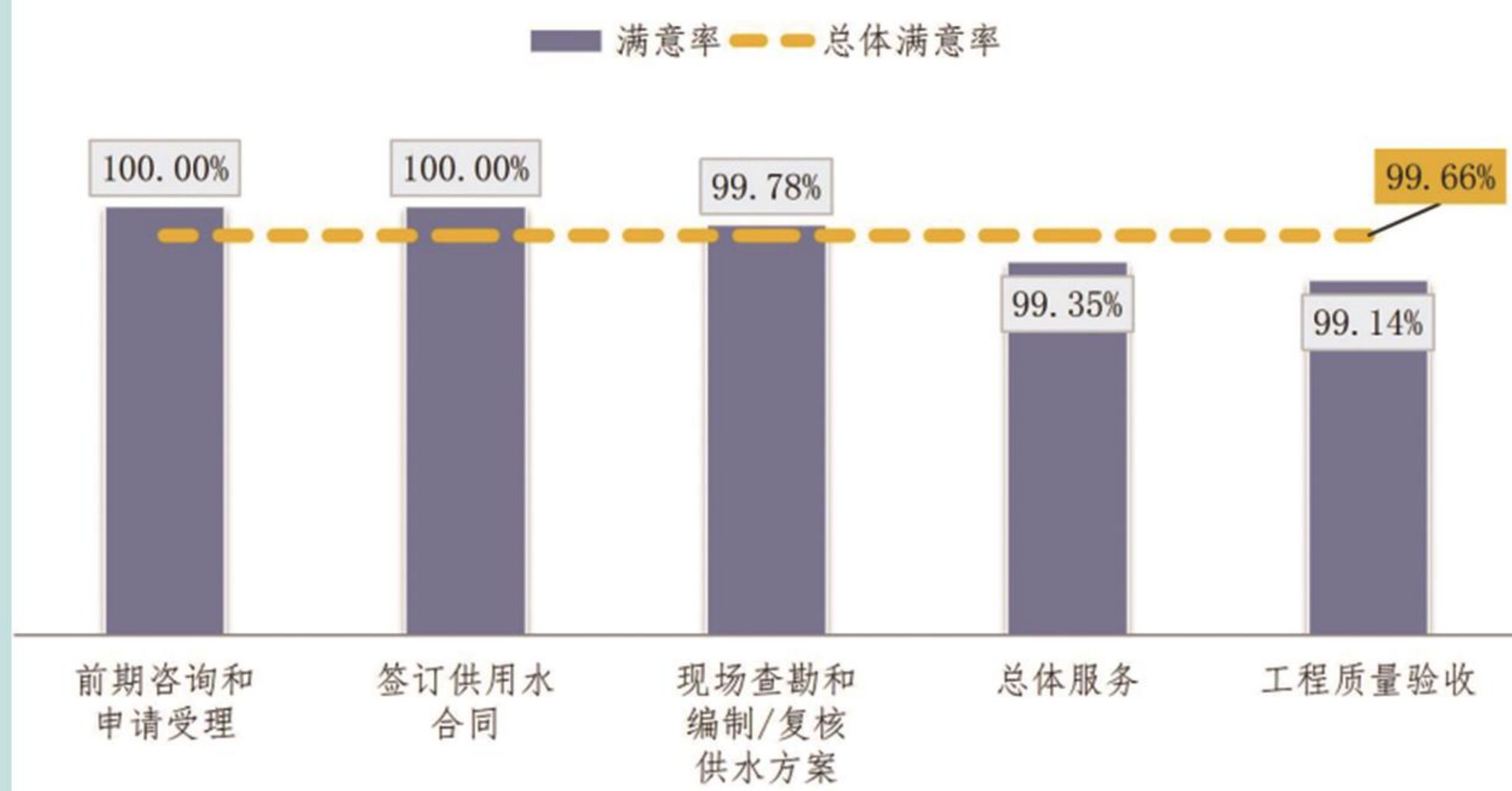
2023年供水接入测评结果

开展上海市供排水接入服务满意度调查，通过对申请办理过供排水接入服务的企业用户进行调查，从前期咨询和申请受理、现场查勘和编制复核供水方案、工程质量验收、签订供用水合同、总体服务五个指标评价供水排水接入服务的便利性和服务满意率。